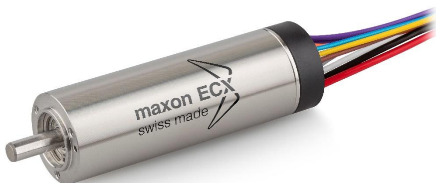
ECX SPEED 19 L: le moteur DC sans balais à vitesses de rotation élevées. III. ©maxon motor ag