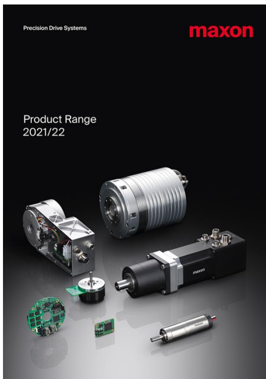
Le nouveau catalogue produits maxon 2021/2022